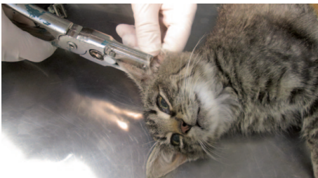
Zusätzlich zur Kastration ist auch die Kennzeichnung der kastrierten Tiere enorm wichtig.