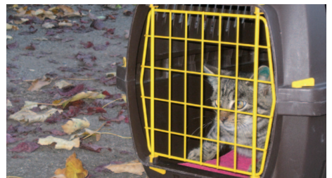
Sobald die Niemandskatzen wieder fit sind, geht`s zurück an ihren gewohnten Lebensort.