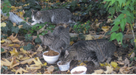
Die Niemandskatzen – unbeachtet fristen sie auf Bauernhöfen, Firmengeländen und in Hinterhöfen ein Leben als Streuner.