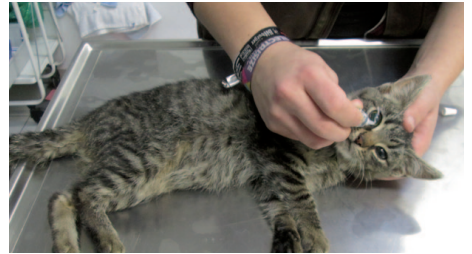
Beim Tierarzt werden die Niemandskatzen...