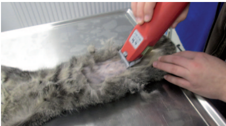
...sorgfältig auf die Operation vorbereitet.