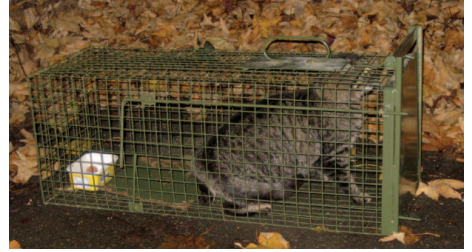
Mit speziellen Lebendfallen werden die äußerst scheuen Tiere eingefangen.